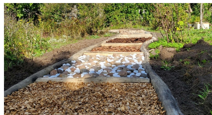
Barfußpfad im Nachbarschaftsgarten

Im Nachbarschaftsgarten wird es bald einen neuen Kompost geben. Mitte Mai einigten sich die Gartennutzer demokratisch auf die Errichtung eines Zwei-Kammer-Komposts. Dieser wird von der WiBB GmbH finanziert und im Juni zwischen Gerätecontainer und Zaun errichtet. In diesem Jahr wird zunächst nur eine Kammer genutzt. Im nächsten Jahr wird der Kompost umgeschichtet, sodass die entstandene Erde für den Garten verwendet werden kann.