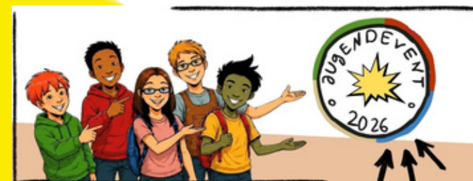
Das Logo des Jugendevent 2026

Entgegen der ursprünglichen Planung hat sich gezeigt, dass der Schulhof der Grund- und Oberschule nicht für die Veranstaltung geeignet ist. Auch wenn die meisten sich gewünscht haben, dass das Event dort stattfinden soll. Mit dem Jugendclub von Rüdersdorf dem „Jugendzentrum Notausgang“ in der Willi-Müller-Straße 11 (Erreichbarkeit: Bus 951; Tram 88 und 10 Minuten Fußweg Haltestelle Museumspark) haben wir aber eine perfekte Lokation gefunden. Wir hoffen, dass ist ok für euch. Wir freuen uns jedenfalls euch bei toller Livemusik und DJ's sowie bei leckerem Essen und einem coolen Getränk zu treffen. Kommt vorbei und seit dabei auf der ersten „unser Sommer“ Party im Notausgang.