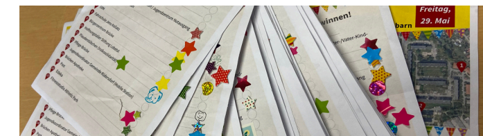
Tag der Nachbarn 2026: Stempelkarten-Aktion

Der Tag der Städtebauförderung auf dem Rüdersdorfer Marktplatz zog zahlreiche Besucherinnen und Besucher an. Im Mittelpunkt standen das 70-jährige Jubiläum des Kulturhauses Rüdersdorf sowie Informationen zu den geplanten Sanierungsmaßnahmen. Darüber hinaus präsentierten das Quartiersmanagement, der Nachbarschaftsgarten, das Jugendzentrum Notausgang und weitere Akteure ihre Angebote und Projekte. Die Veranstaltung bot viele Möglichkeiten für Gespräche, Information und Austausch.