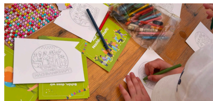
Tag der Nachbarn 2026: Kinder bemalen Grußkarten

Quartiersmanagement Bürgerzentrum Brücke